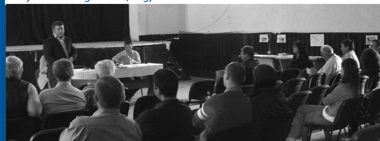
Szentegyháza, 2009. július