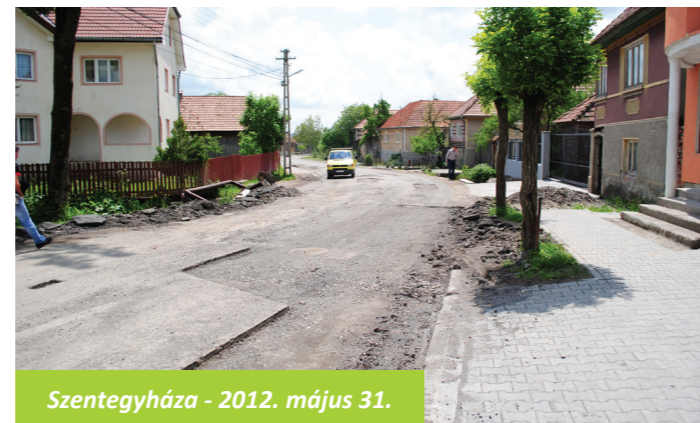
Szentegyháza - 2012. május 31.

A továbbiakban is tájékoztatjuk a lakosságot az új kivitelező kitérő, a hátralévő munkálatok ütemtervéről és minden előrelépésről, valamint várjuk észrevételeiket.