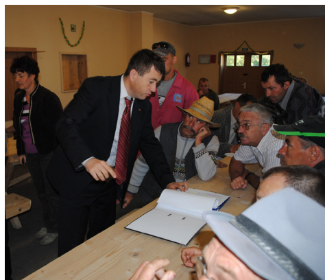
A patakfalvi lakosokkal is sikerült megegyezni