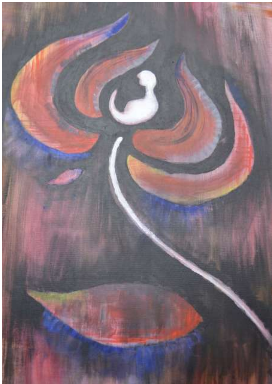
„Omul, în adâncul inimii, aparține locului unde s-a născut.” Tamási Áron