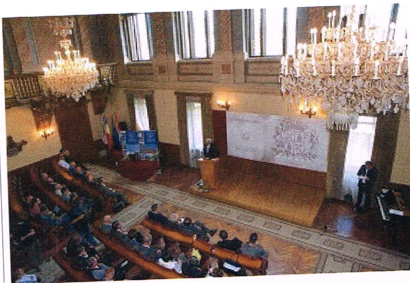
Ședință festivă , Odorheiu Secuiesc, 3. iunie 2014.

În cursul anului 2014 am participat la 21 ședințe, din 22, ale Consiliului Județean Harghita.