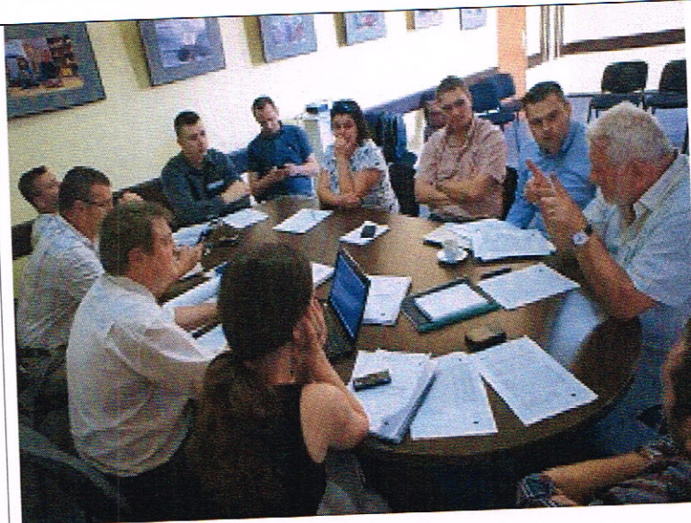
Întâlnire de lucru privind proiectul Harghita Business Center, Odorheiu Secuiesc